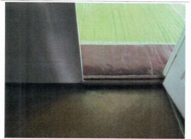
Фото №18 – Пути движения внутри здания (двери)