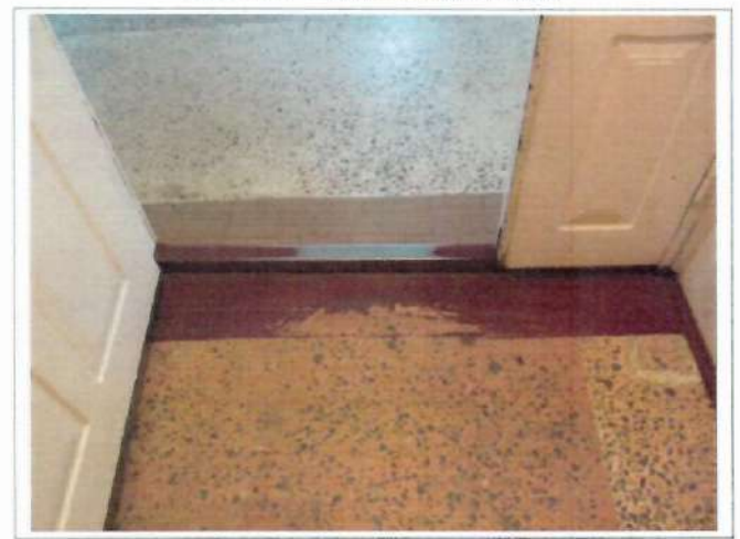
Фото №12 – Внутренняя входная дверь