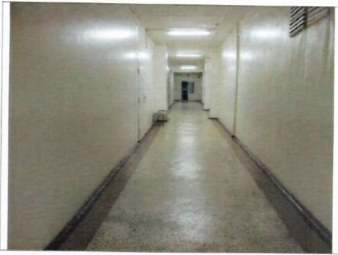
Фото №13 – Пути движения внутри здания (коридор)