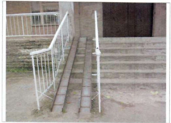
Фото №8 – Пандус