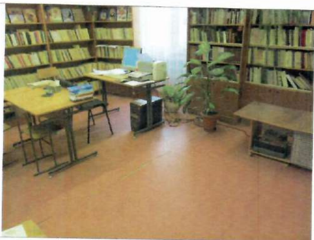
Фото №26 – Зона целевого назначения здания (форма обслуживания с перемещением по маршруту)