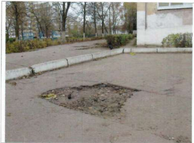
Фото №5 – Прилегающая территория