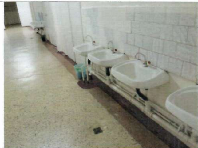
Фото №35 – Раковина у столовой зоны