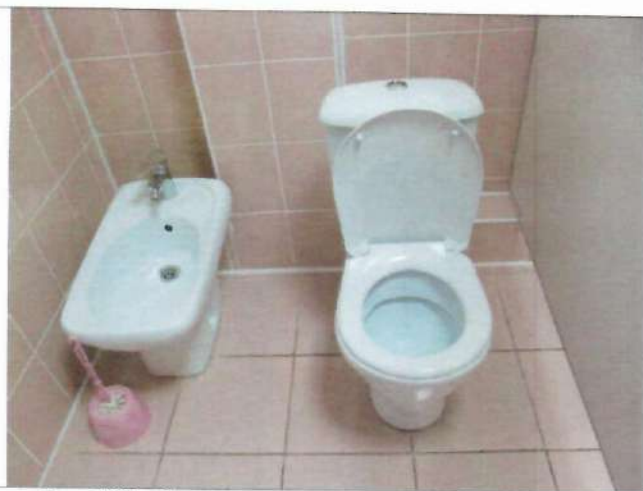
Фото №32 – Санитарно-гигиеническое помещение (туалетная кабина)