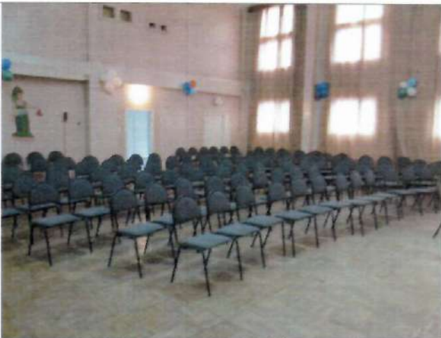
Фото №23 – Зона целевого назначения здания (зальная форма обслуживания)