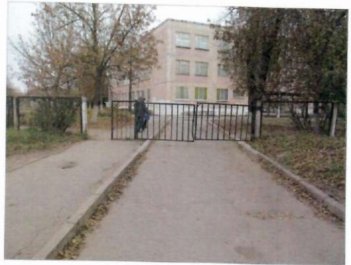
Фото №2 – Подходы к объекту