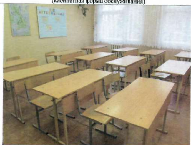
Фото №30 - Зона целевого назначения здания (кабинетная форма обслуживания)