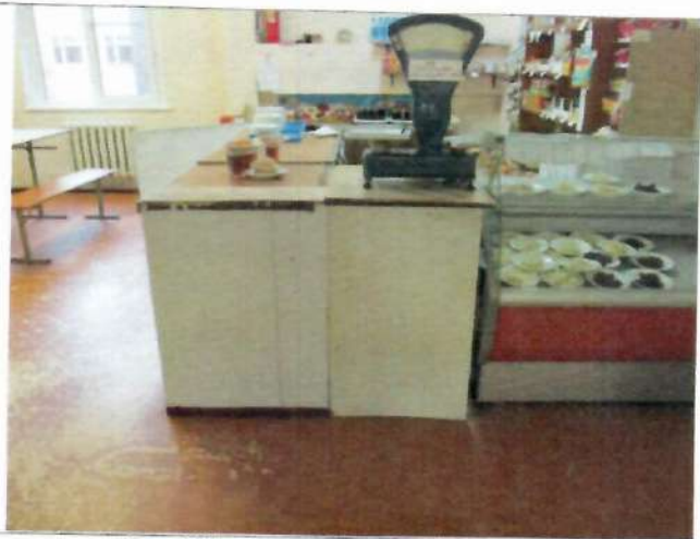
Фото №25 – Зона целевого назначения здания (прилавочная форма обслуживания)