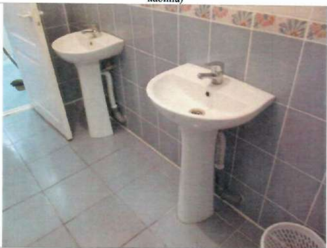
Фото №34 – Санитарно-гигиеническое помещение (раковина)