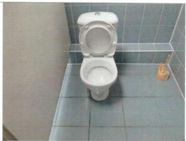
Фото №33 – Санитарно-гигиеническое помещение (туалетная кабина)