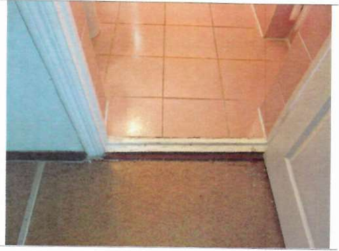
Фото №20 - Пути движения внутри здания (двери)