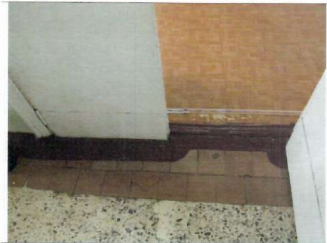
Фото №17 – Пути движения внутри здания (двери)