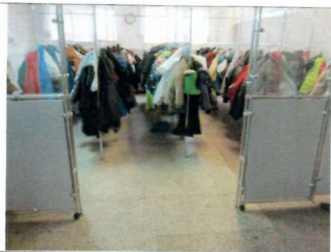
Фото №31 – Гардероб.