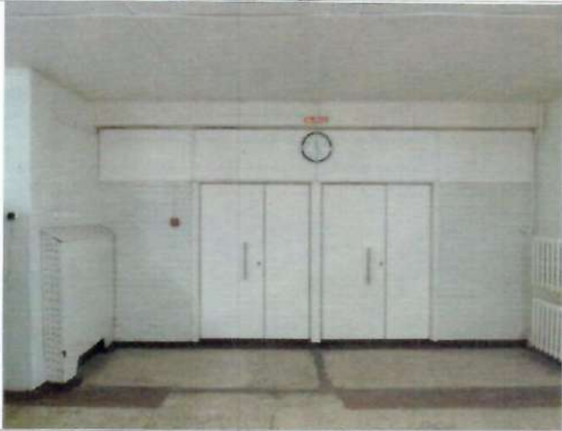
Фото №21– Запасной выход