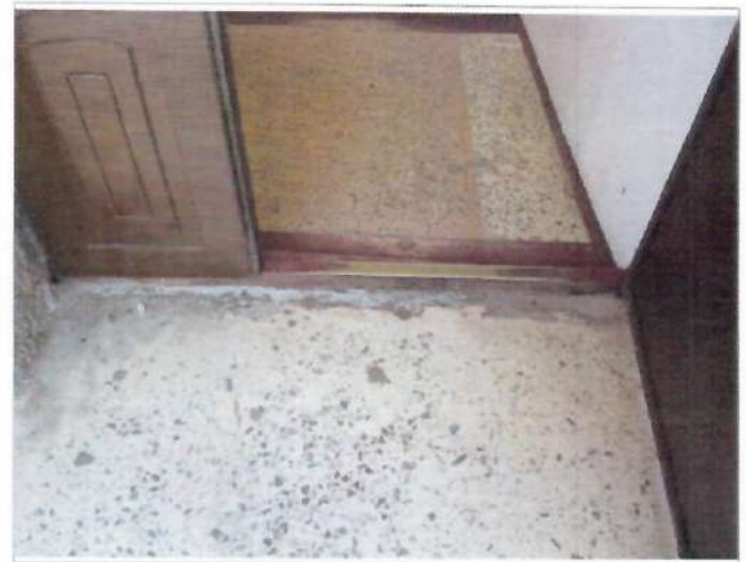
Фото №10 – Наружная входная дверь