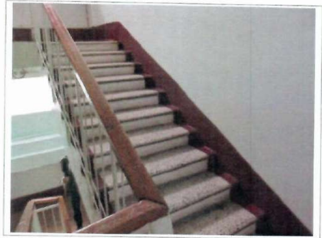
Фото №14 – Пути движения внутри здания (лестницы)