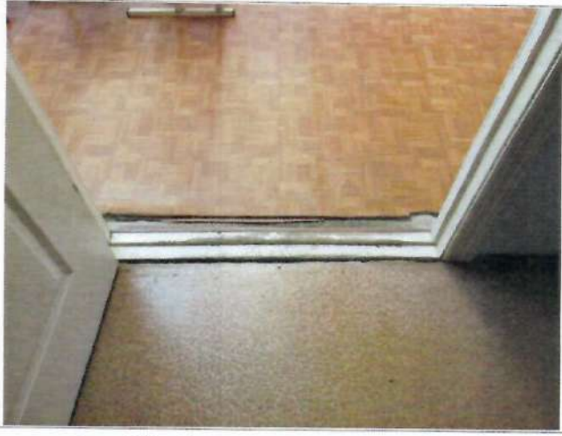
Фото №19 – Пути движения внутри здания (двери)