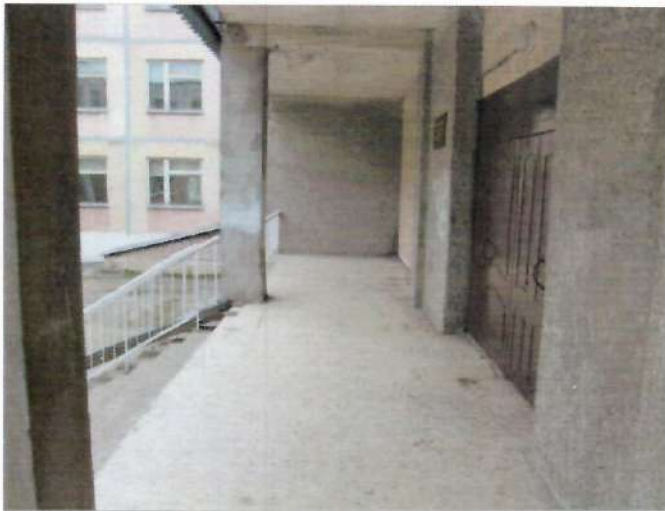
Фото №9 – Входная площадка главного входа