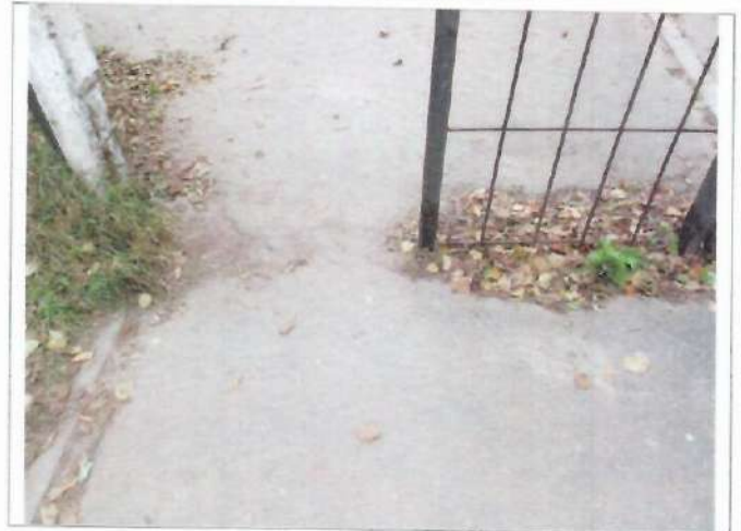
Фото №4 – Вход на прилегающую территорию