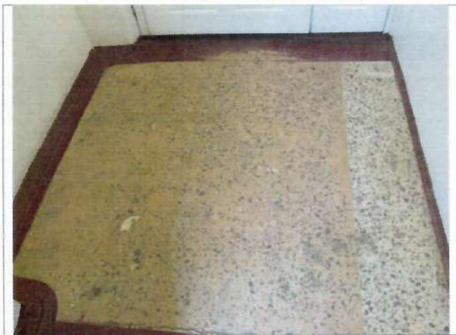
Фото №11 – Тамбур