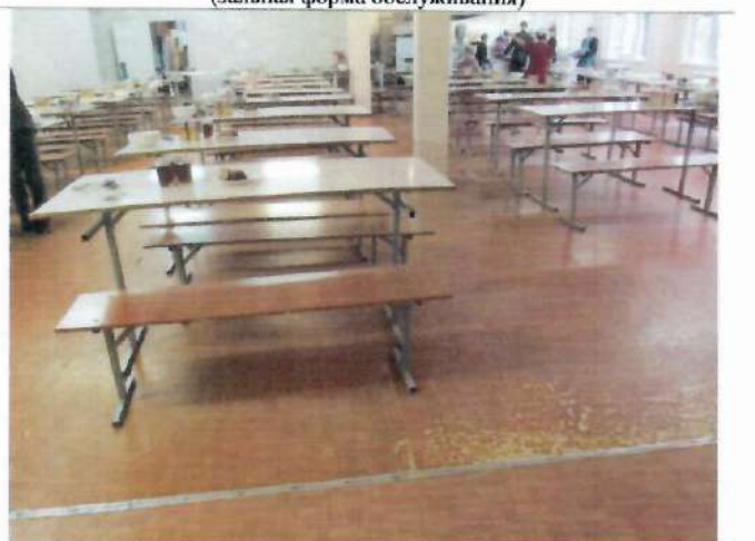
Фото №24 – Зона целевого назначения здания (зальная форма обслуживания)