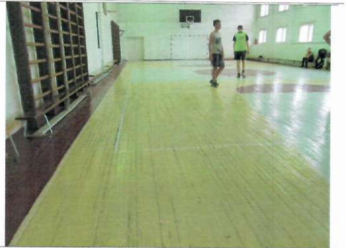
Фото №22 – Зона целевого назначения здания (зальная форма обслуживания)