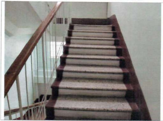
Фото №15 – Пути движения внутри здания (лестницы)