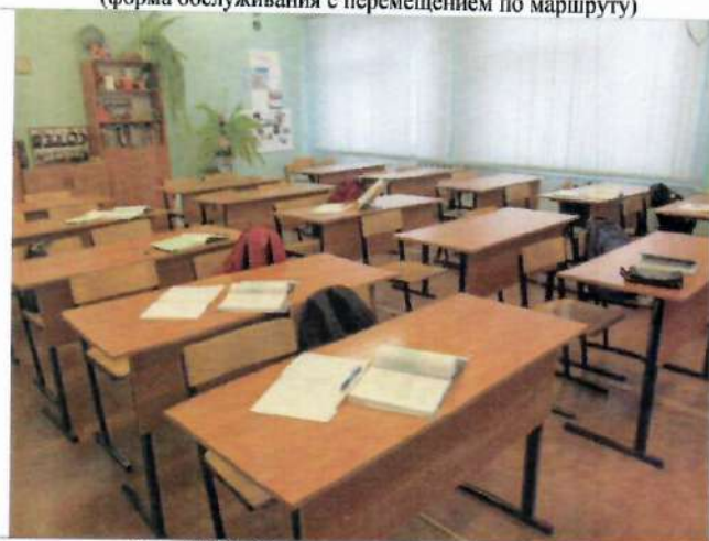
Фото №28 – Зона целевого назначения здания (кабинетная форма обслуживания)