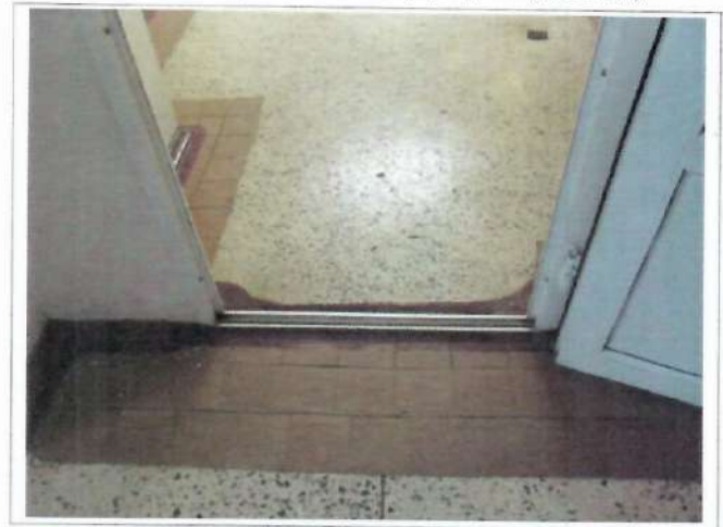
Фото №16 – Пути движения внутри здания (двери)