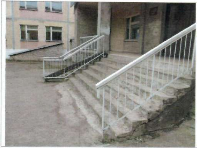
Фото №7 – Наружная лестница