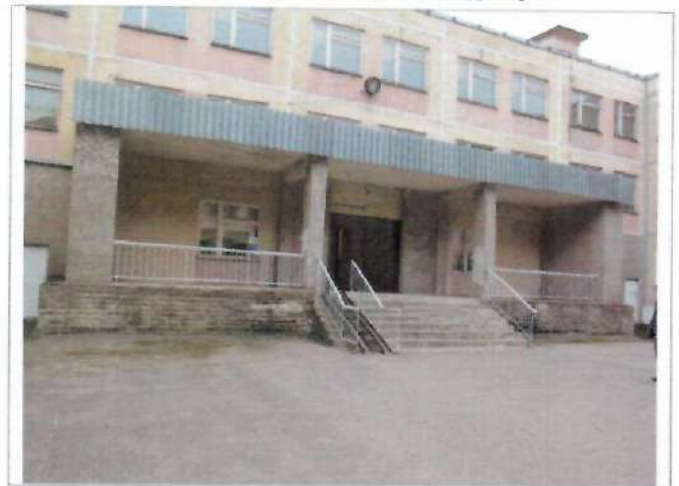
Фото №6 – Главный вход