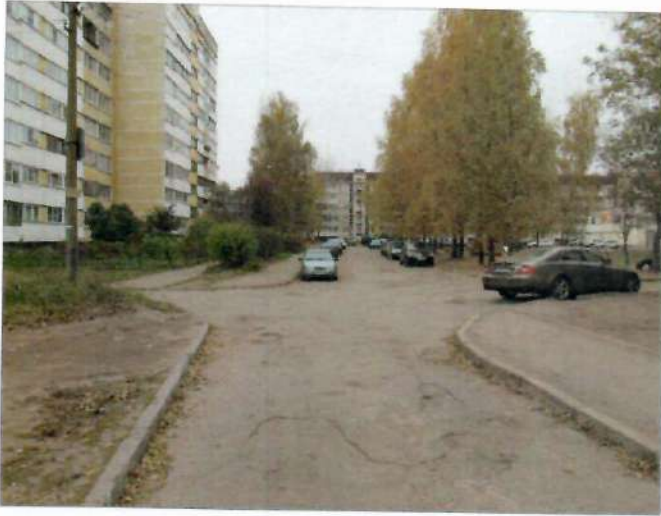
Фото №1 – Подходы к объекту