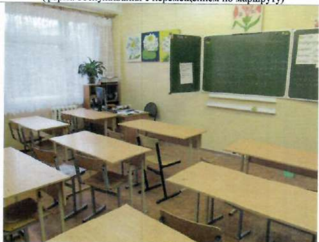
Фото №29 – Зона целевого назначения здания (кабинетная форма обслуживания)