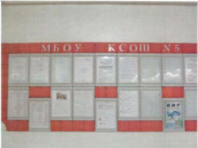
Фото №36 – Система информации