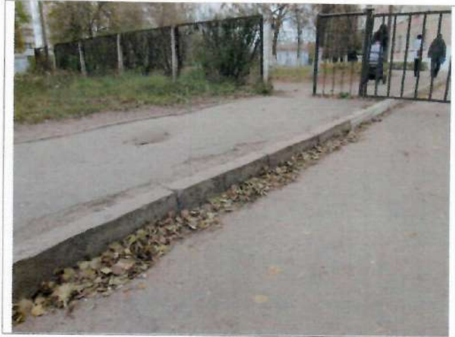
Фото №3 – Подходы к объекту