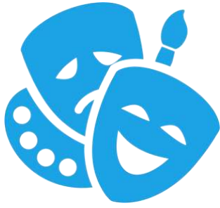
Логотип трека «Орлёнок – Мастер»