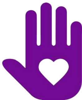
Логотип трека «Орлёнок – Доброволец»

Реализация трека проходит для ребят 1-х классов в начале декабря, но его тематика актуальна круглый год. Важно, как можно раньше познакомить обучающихся с понятиями «доброволец», «волонтёр», «волонтёрское движение». Рассказывая о тимуровском движении, в котором участвовали их бабушки и дедушки, показать преемственность традиций помощи и участия. В решении данных задач учителю поможет празднование в России 5 декабря Дня волонтёра.